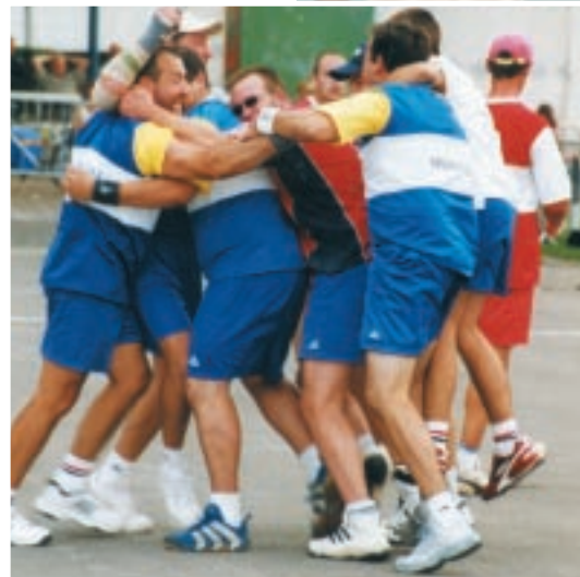
Une équipe victorieuse au 15 août