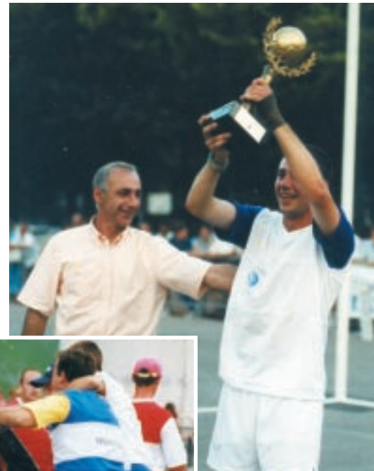
Le Poing d'Or

De nos jours, il se pratique principalement dans le triangle géographique Amiens – Albert – Doullens avec une enclave à Saint-Aubin-Montenoy au sud d'Amiens.